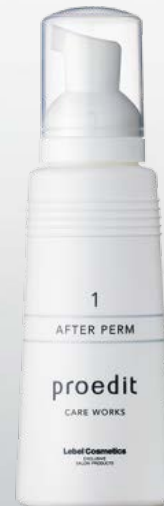
Сыворотка 1 AFTER PERM

Подготавливает волосы к восстановлению после химических воздействий